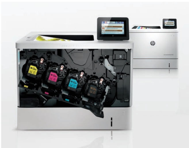
HP LaserJet. D'excellents résultats et une fiabilité constante.