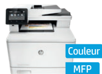
Série HP Color LaserJet Pro MFP M477