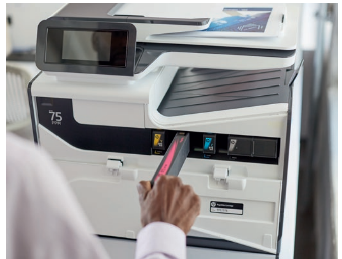
HP PageWide. L'impact le plus faible en termes d'empreinte carbone.