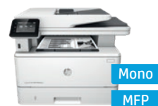
Série HP LaserJet Pro MFP M426