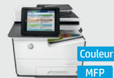
Série HP PageWide Enterprise Color MFP 586*