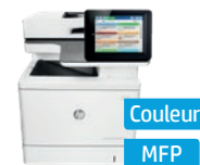
Série HP Color LaserJet Enterprise MFP M577*