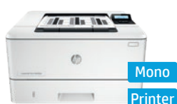
Série HP LaserJet Pro M402

Ces produits sont disponibles en plusieurs versions. Certains contiennent des variantes en termes de duplex, sans fil, télécopie. Pour les MFP Enterprise, il existe toujours une variante avec option Flow. De plus, HP offre une vaste gamme d'autres appareils pour répondre aux besoins spécifiques de vos clients. Consultez notre site ou le HP Sales Central pour en savoir plus, ou contactez votre directeur clientèle HP.