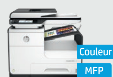
HP PageWide Pro MFP 477dw