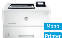
Série HP LaserJet Enterprise M506