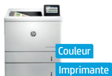
Série HP Color LaserJet Enterprise M553