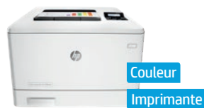
Série HP Color LaserJet Pro M452