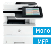
Série HP LaserJet Enterprise MFP M527*